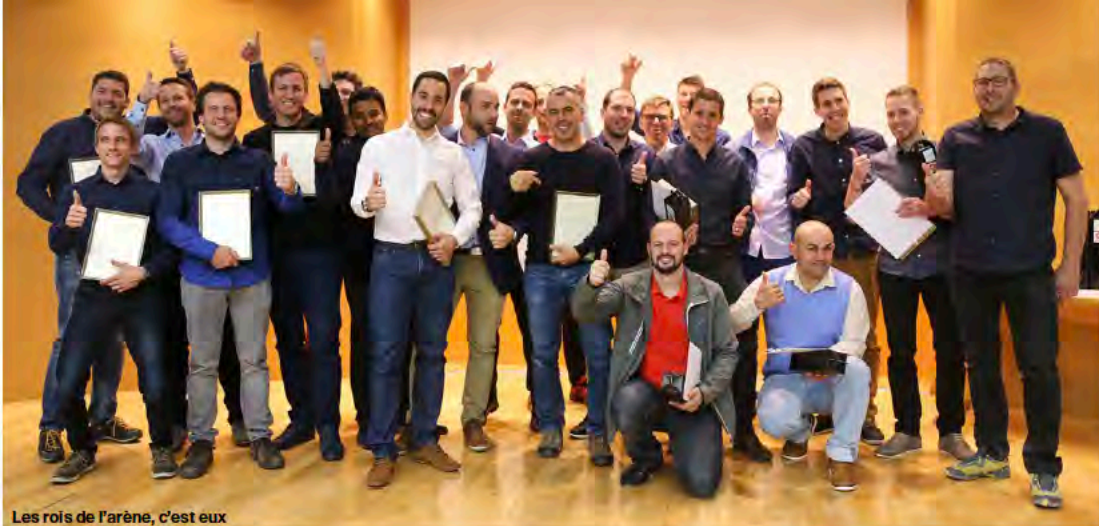
Les rois de l'arène, c'est eux